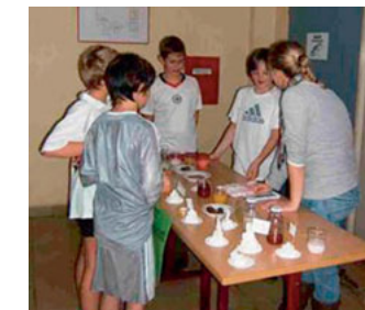
Projekt Schulkinder und ihre Ernährung